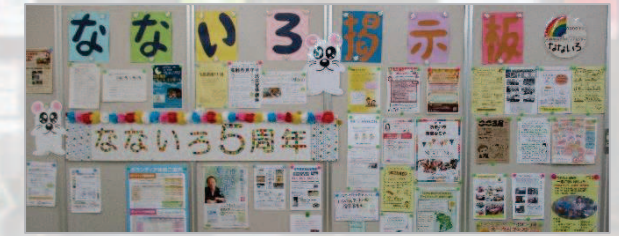
▲掲示板はイベントの情報でいっぱい