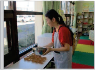
▲この日は学生ボランティアさんが初参加