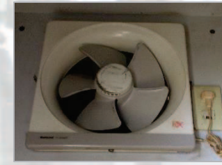
▲換気扇とエアコンの掃除依頼の現場確認