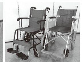
介助用(社会福祉協議会のみ貸出可)