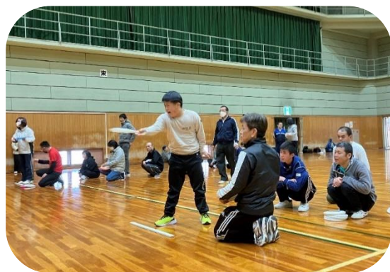
障害者スポーツ普及事業