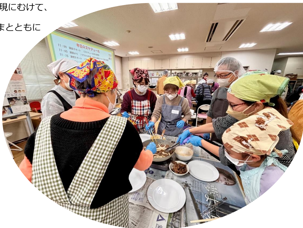
居場所づくり推進事業