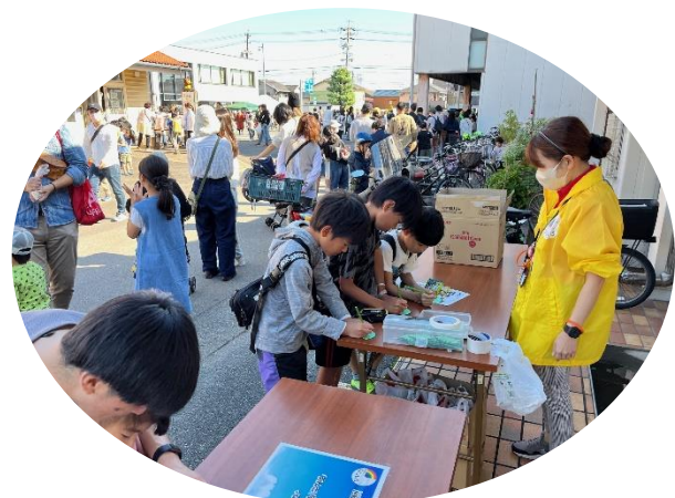
イベントへの出展(コミュニティ祭り)