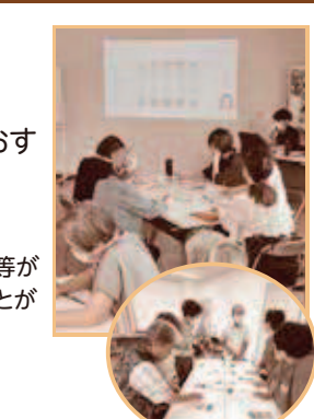
▲おすそわけ隊養成講座の様子

【問い合わせ】 東浦町総合ボランティアセンターなないろ ☎0562-51-7697