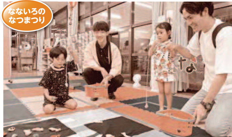
なないろのなまつり