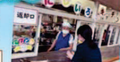
にじどん(なごみ食堂)