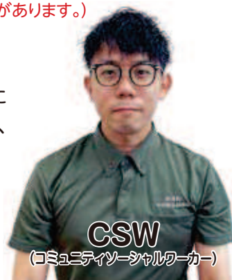
CSW (コミュニティソーシャルワーカー)