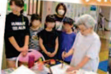
宿題やっちゃん塾