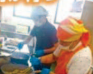
にじどん(メンス倶楽部)