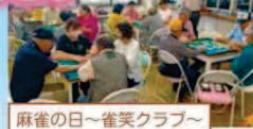
麻雀の日～雀笑クラブ～