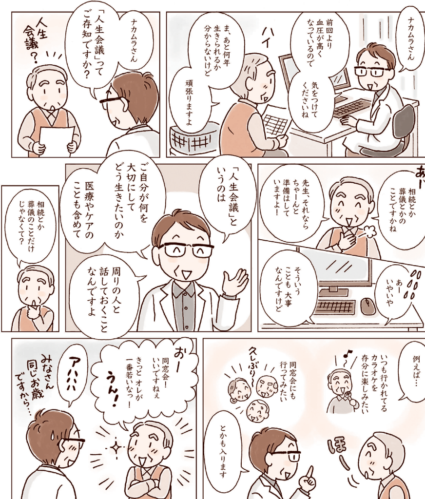
イラスト: 横谷智子