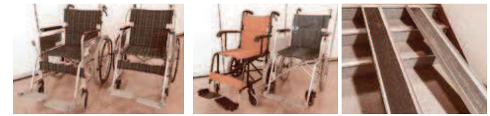
車いす(自走用) 車いす(介助用) スロープ (※社会福祉協議会のみ貸出可)

身体障がい、傷病、高齢等により歩行が困難な方の外出の便宜を図るため、車いす(非電動)・スロープの貸出を行っています。