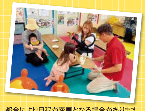
都合により日程が変更となる場合があります