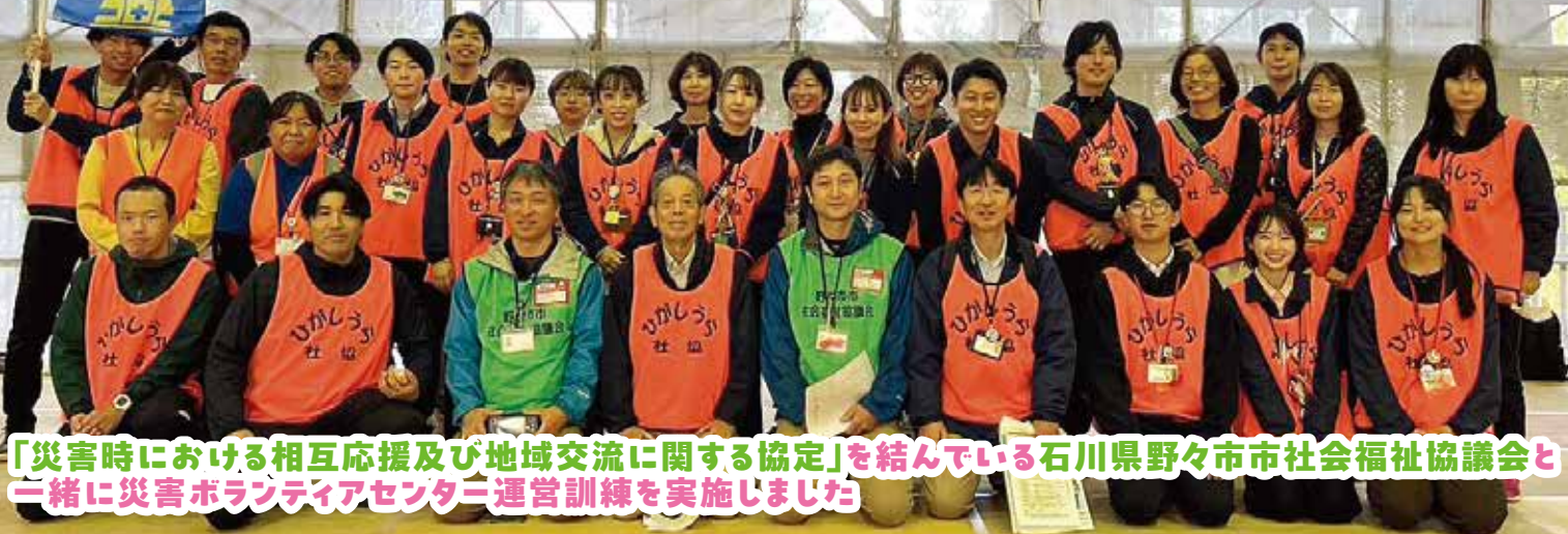
「災害時における相互応援及び地域交流に関する協定」を結んでいる石川県野々市市社会福祉協議会と一緒に災害ボランティアセンター運営訓練を実施しました